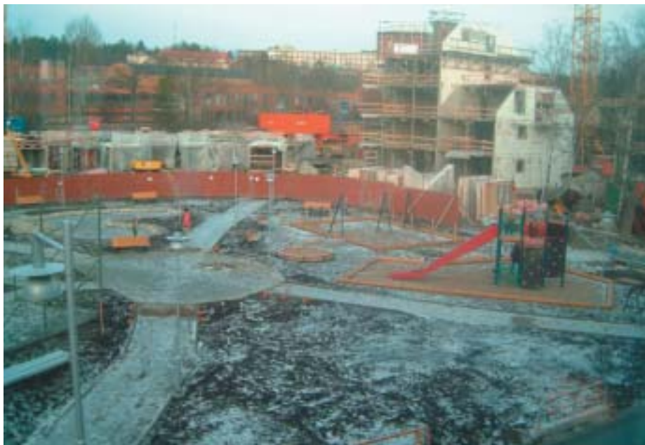
Till vänster skymtar fotbollsplanen. Ovanför mittcirkeln står ett barn på isen i den nu igenfrusna dammen. Till höger pågår bygget av brf Marketenteriet.

Planket har satts upp på andra sidan parken mot järnvägen. När byggena är klara flyttas Järsla gårdsväg också dit och den nuvarande lokalvägen enkelriktas. Snedparkeringarna kommer då att återinföras på Järsla gårdsväg vid parken.